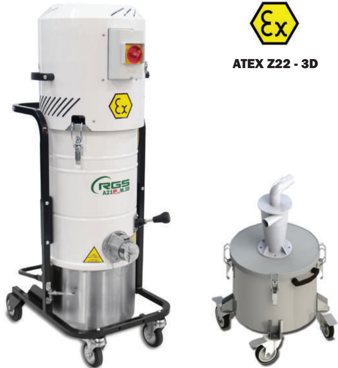
ATEX Z22 - 3D

Cuando se recuperan estos polvos, se utiliza un separador ciclónico entre la manguera de aspiración y el aspirador para evitar la contaminación entre las diferentes mezclas.