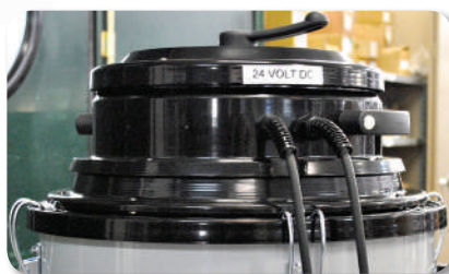
4 В напряжение