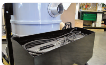
Отсек для аккумуляторов