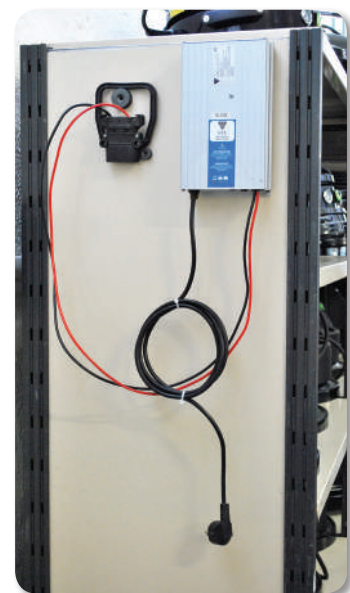
Зарядное устройство для аккумуляторов